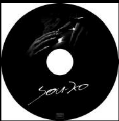
Album "Sou-Ko"-Sortie en 2016

Créé fin 2014, Sou-Ko a sorti trois albums :