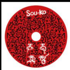
Album "Assinie" - Sortie en Mai 2018